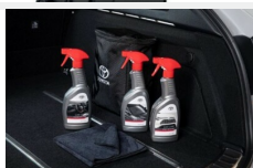
Zestaw kosmetyków samochodowych Toyota Kosmetyki